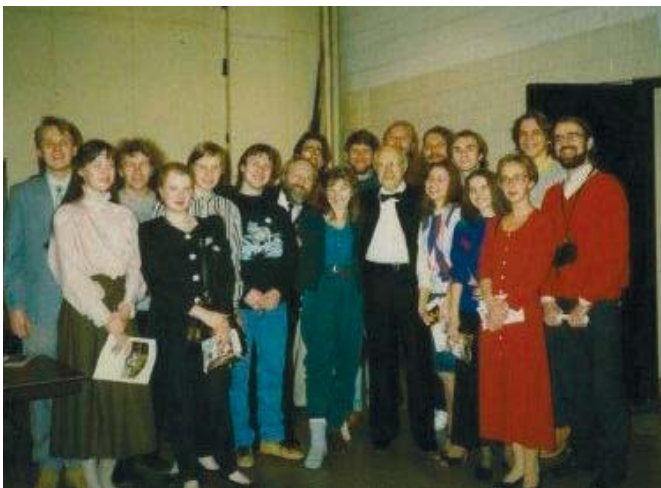
«Тойве» с М.Л. Ростроповичем

В репертуаре «Тойве» несколько концертных программ: «Архаические (эпические) формы культуры Карелии», «Народная музыка Северной Карелии», «Народная музыка Южной Карелии», «Народная музыка Ингерманландии». При создании программ руководители ансамбля, придерживаясь территориального принципа отбора материала, опирались на научные исследования этнографов, археологов, лингвистов, историков, этномузыковедов, материалы фонограммархивов Петрозаводской государственной консерватории, Карельского филиала Академии наук (ИЯЛИ), Дома народного творчества, а также на материалы собственных фольклорных экспедиций. В течение последнего десятилетия участники ансамбля осваивают певческо-инструментальные традиции шведов, норвежцев, марийцев, удмуртов, саами. Появились программы «Музыка и танцы народов Скандинавии», «Музыка и танцы финно-угорских народов», идея возникновения которых сложи-