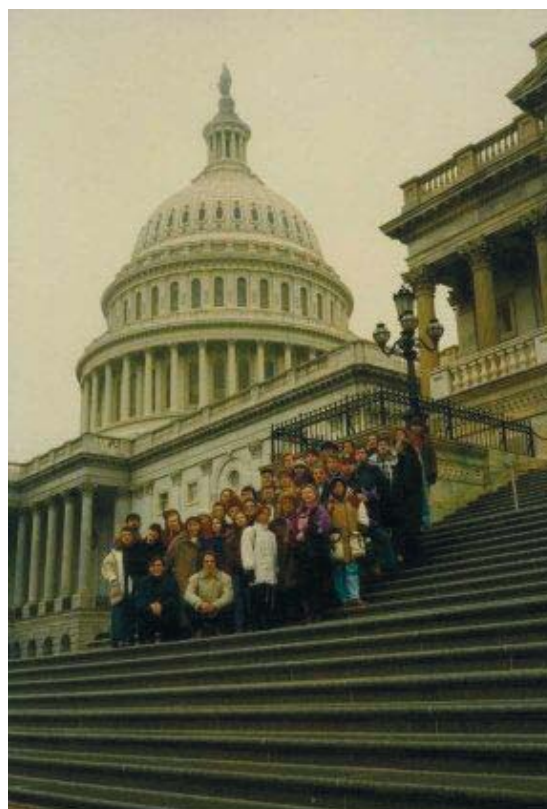
«Тойве» в США (1993 г.)

С 2004 года участники ансамбля ежегодно выезжают на «Водлозерские каникулы» в Пудожский район Карелии. Жизнь на Водлозере — особая студенческая практика. Именно в Водлозерье ансамбль превращается в настоящую, большую, творческую семью. Атмосфера веры и любви заставля-