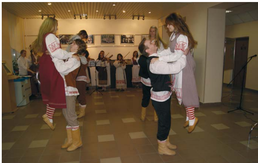
«Тойве» на открытии выставки в ПетрГУ (октябрь 2012 г.)