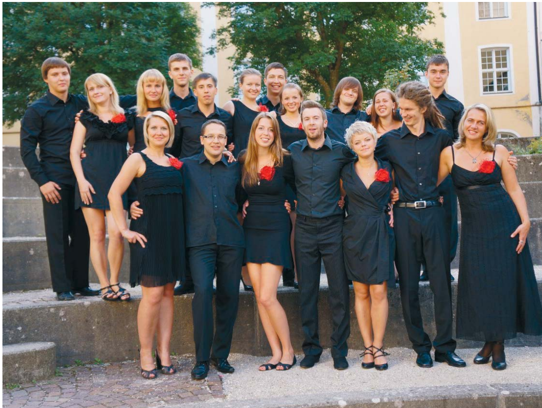
Академический хор ПетрГУ

Люди здесь обучаются английскому языку за три дня, а новыми друзьями обзаводятся всего за два. И всего одно утро после первой же интернациональной вечеринки требуется на то, чтобы познать все скрытые резервы своего организма. Так что десять дней уйдут, а воспоминаний останется... – кто сколько сможет увезти с собой! С.Н.О.И.Р. – один из наиболее замеча-