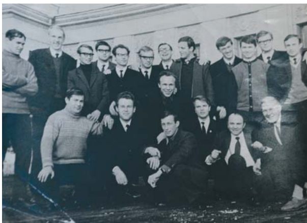
Май 1970 г. 2-я группа инженеров-механиков ЛИФа

Я жил в общежитии на пр. Ленина, 31. На 1-м курсе женился. Параллельно с учебой работал: иногда сторожем, иногда дворником, грузчиком, работал в автоколонне, так как имел водительские права. На 2-м курсе у меня родился сын. Жизнь шла своим чередом, я радовался, что учусь. После окончания университета некоторое время работал в Медвежьегорском леспромхозе инженером-механиком.