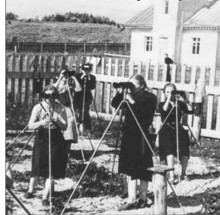
На метеостанции в Сулажгоре

денты получали удостоверения рационализаторов и изобретателей.