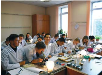
Студенты на занятиях