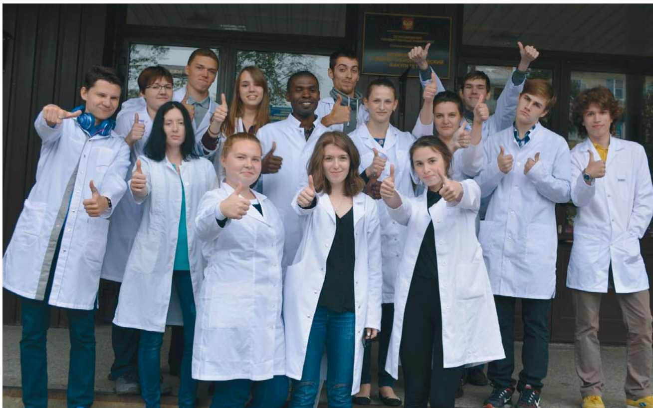
Студенты 1-го курса Медицинского института

Медицинский институт ПетрГУ отмечает 55-летие