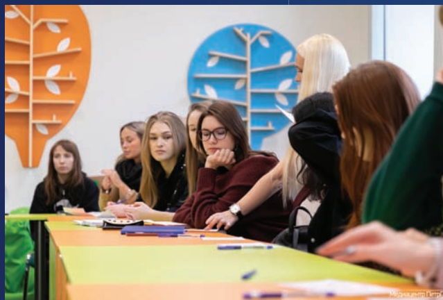
Тесное взаимодействие с образовательными организациями