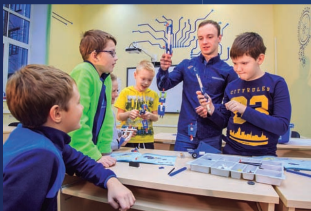
Практика в детских садах и школах республики