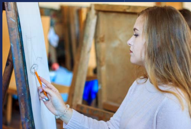
Высшее образование в сфере искусства и дизайна